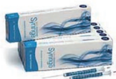
ブルーライン オートサンプリング