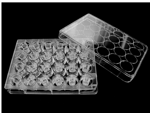
図1 ad-MED ビトリゲル®2 (24 ウェル)

ad-MED ビトリゲル®2 (24 ウェル) (図 1) は、生体内の結合組織に匹敵する高密度コラーゲン線維構造を持つコラーゲンビトリゲル膜を使った細胞培養用器材です。細胞接着活性や細胞伸展活性が高いことが大きな特徴で、広範な細胞に対し、良好な細胞培養が可能です。