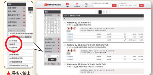
▲ 規格で抽出 例：NMR用