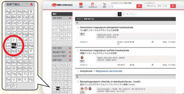
▲ 金属で抽出 例：Mg

目的の金属の元素記号を選択すると、該当する金属化合物を抽出して表示できます。プルダウンメニューより、お探しの規格名を選択すると、該当製品を表示できます。