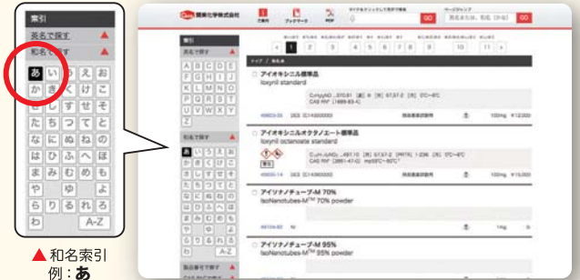
▲ 和名索引 例：あ